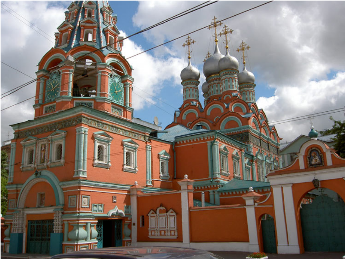
Fig. n. 4 – Mosca, il complesso monumentale della chiesa di San Gregorio Taumaturgo oggi.