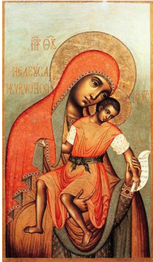
Fig. n. 11- Icona “Madre di Dio Kikkotissa”, capolavoro del 1668 del maestro iconografo Simon Fëdorovič Ušakov. L'icona, un tempo venerata nella chiesa di San Gregorio Taumaturgo a Mosca, è conservata presso la Galleria Tretiakov

Milano, 2 aprile 2008 Festa di San Francesco da Paola , Patrono della Calabria.