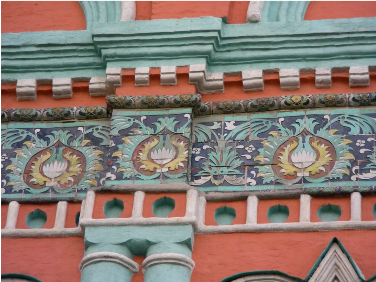
Fig. n. 6 – In primo piano, un tratto della cintura di novemila piastrelle in stile “occhio di pavone”, decorate a fuoco e di vari colori, che si distribuisce tutt’attorno l’esterno della chiesa di San Gregorio Taumaturgo a Mosca. La cosiddetta “pavonia”, opera del maestro Stepan Polubes, viene considerata un capolavoro assoluto dell’arte ceramica del XVII secolo, e ha contribuito a rendere famosa la chiesa nel mondo. Il Polubes è stato uno dei più apprezzati artisti di corte nell’età di Pietro il Grande. Noto il suo contributo nella decorazione degli edifici della città di Mosca.