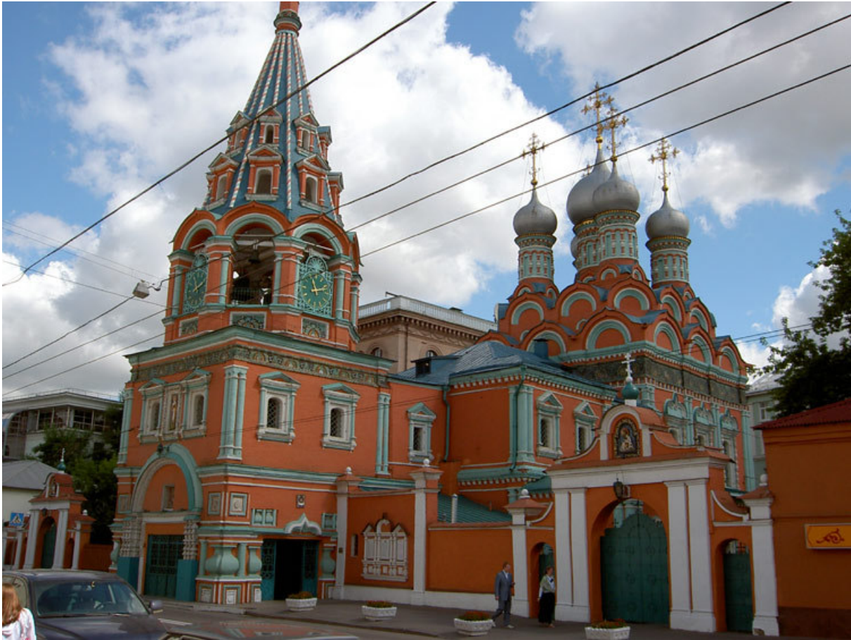
Fig. n.1 - La chiesa di San Gregorio Taumaturgo da Neocesarea, a Mosca

La più bella chiesa al mondo dedicata a San Gregorio Taumaturgo, Padre della Chiesa del III secolo, si trova a Mosca 1 . Si tratta del principale luogo di culto consacrato al santo Taumaturgo nel mondo Ortodosso 2 . La sua fondazione risale al XV secolo ed è legata a un evento di grandissima importanza per la storia della Russia. Nel 1445, Basilio II 3 di Russia, Gran Principe di Moscovia 4 ,