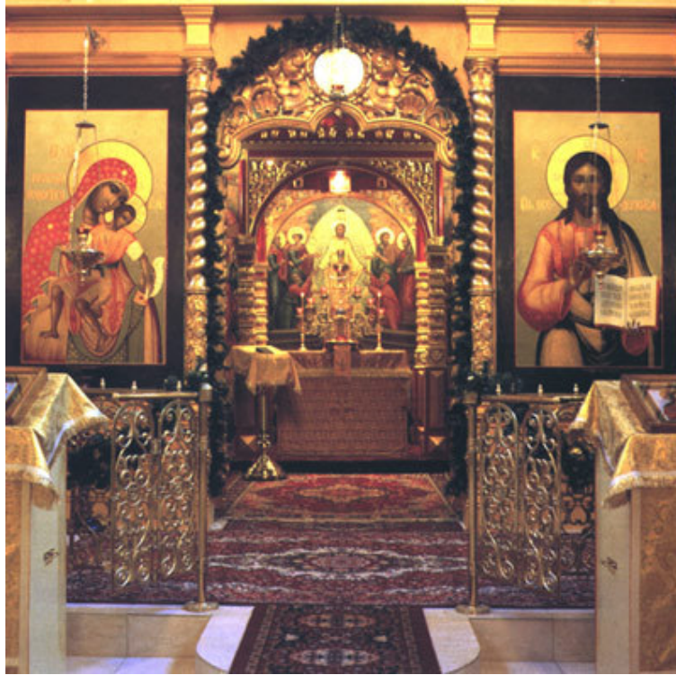
Fig. n. 9, in alto – Nel Santuario della chiesa di San Gregorio Taumaturgo.