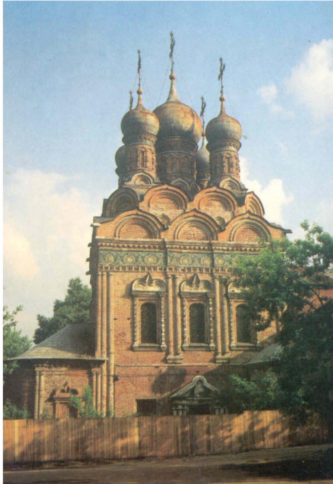
Fig. n. 3 – La chiesa di San Gregorio Taumaturgo a Mosca negli anni bui dell'abbandono, dopo la chiusura decisa dal regime comunista. Il santuario, dopo essere stato spogliato delle sacre e antiche icone, consegnate alla Galleria Tretiakov, ha corso il rischio di essere abbattuto. Per anni la chiesa è stata "occupata" da diversi enti pubblici, che vi hanno collocato i propri uffici. È stata restituita al popolo dei fedeli soltanto nel 1990, grazie all'intervento del Patriarca di Mosca Alessio II.