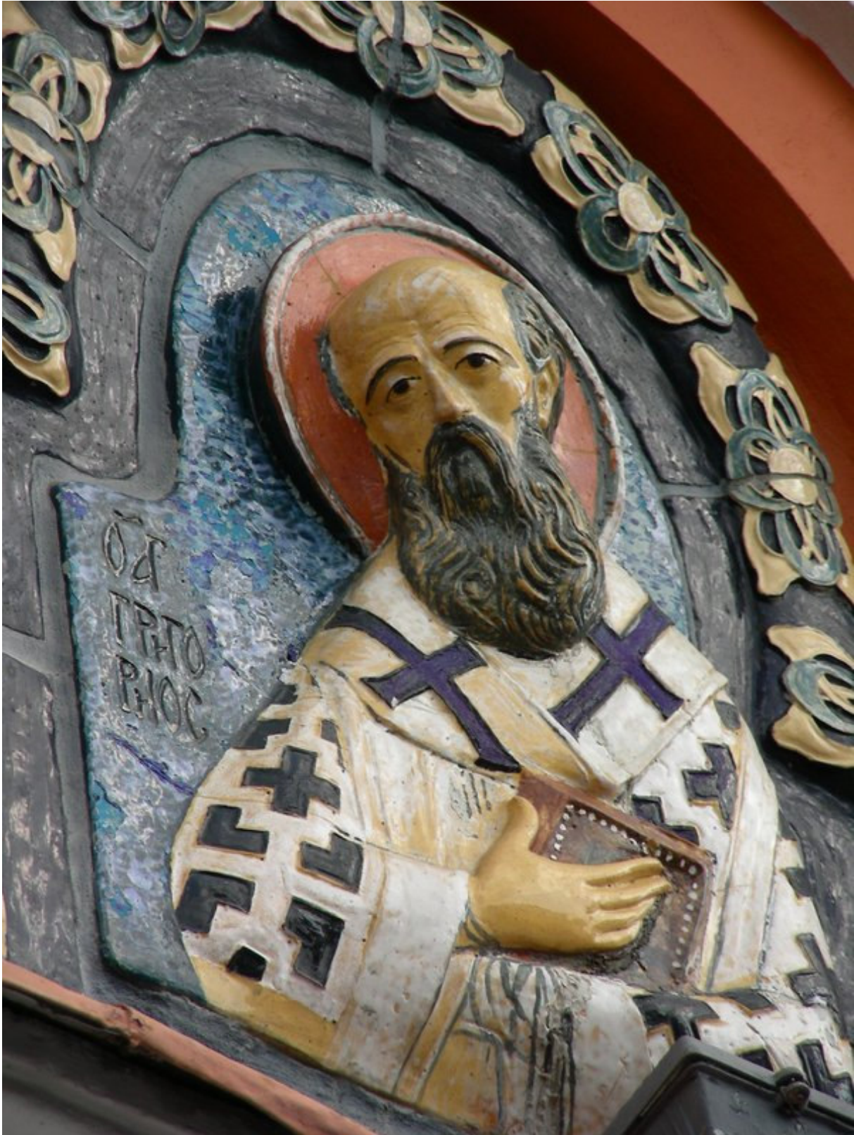
Fig. n. 8 – Bassorilievo in ceramica raffigurante San Gregorio Taumaturgo, realizzato dal maestro Stepan Polubes nel XVI secolo, collocato in una nicchia in cima all'arco d'ingresso del complesso monumentale dedicato al Santo a Mosca.