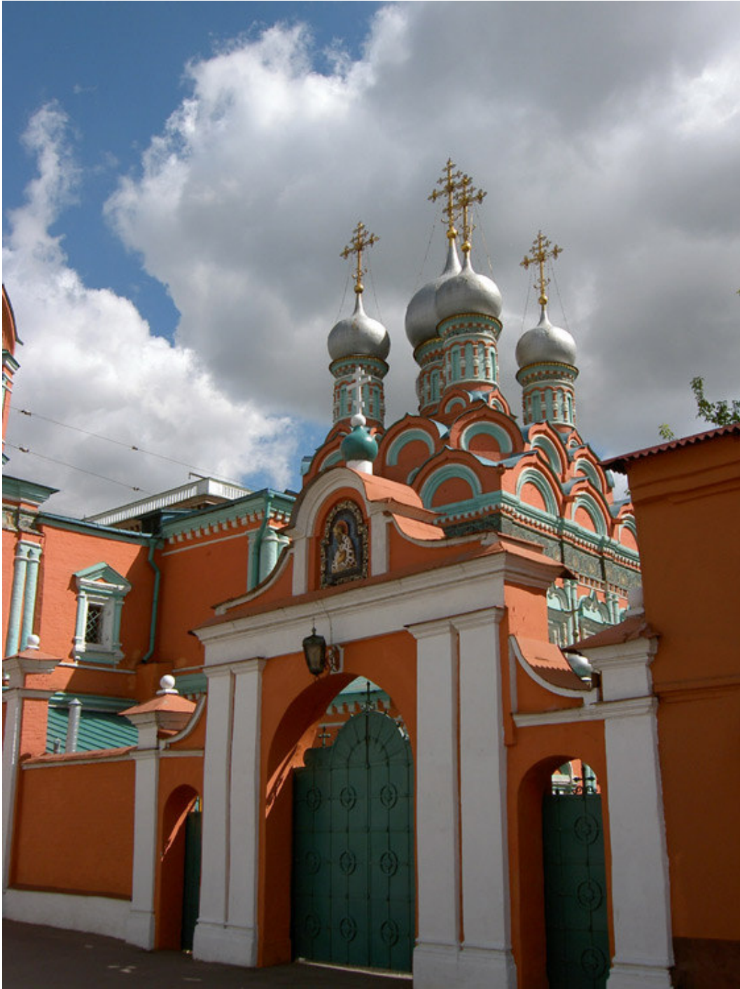
Fig. n. 7 – L'ingresso al complesso monumentale della chiesa di San Gregorio Taumaturgo a Mosca