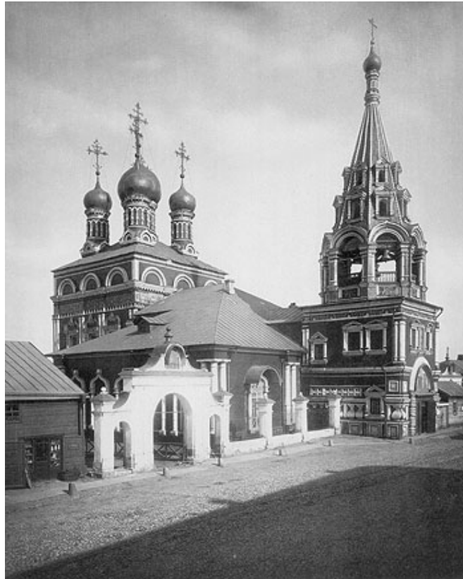
Fig. n. 2 – Una rara immagine della chiesa di San Gregorio Taumaturgo a Mosca. La foto risale all'inizio del secolo scorso. A destra, il campanile realizzato nel XVIII secolo appare ancora integro. Negli anni trenta, subirà lo sventramento della base per lasciare il passaggio a un marciapiede. L'intervento distruttivo è stato deciso dal Consiglio della Città di Mosca, che aveva accolto un'indicazione del Programma Generale del 1935.