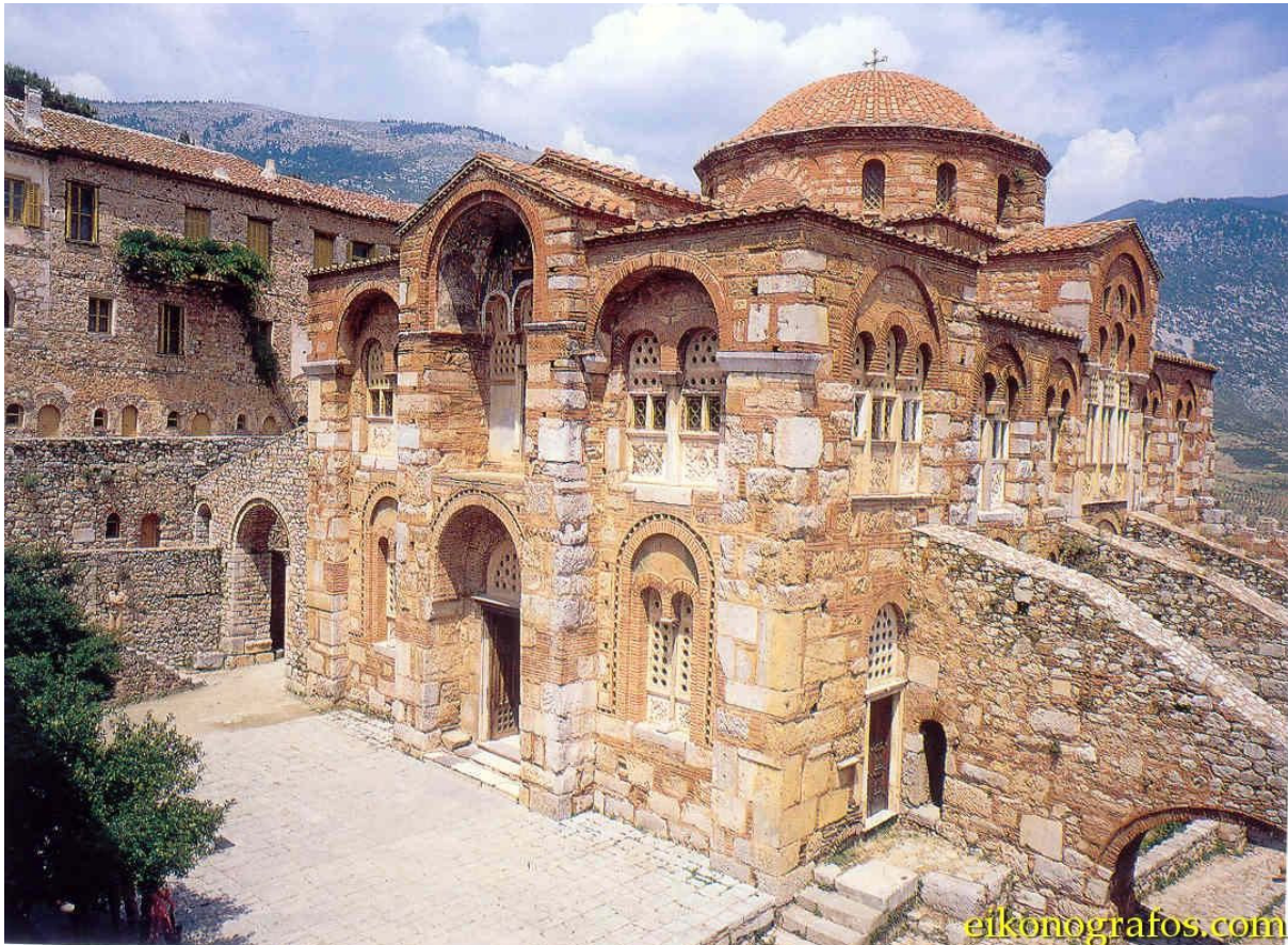
Fig. 1 - Monastero di Ossios Loukas in Focide (Grecia).

Il monastero di Ossios Loukas è uno dei più importanti monumenti bizantini della Grecia. Fu fondato nel X secolo da San Luca lo Stiriota, che vi morì nel 953. Il monastero si erge in un luogo solitario alle pendici dell'Elicono, nella Focide, nei pressi della città di Stiris. Vi si custodiscono le reliquie del suo Santo fondatore, da cui prende il nome. La tomba del Santo è stata per secoli meta di pellegrinaggi. I fedeli vi si recavano nella speranza di guarire dalle malattie mediante il "rito della incubazione", che consisteva nel dormire vicino la tomba del Santo. Tale pratica era sostenuta dalla credenza che dalla sepoltura del Santo stillasse il myron , un olio profumato con il potere di guarire dalle malattie. Il complesso monastico comprende due chiese, un refettorio e le celle dei monaci. La chiesa più antica è dedicata a Santa Maria Theotokos, ed è detta anche chiesa della Panaghia . Accanto a questa, agli inizi del secolo XI, fu costruita la seconda chiesa, il Katholikon , decorato con splendidi mosaici, in gran parte conservati, annoverati fra le più alte espressioni dell'arte musiva bizantina.